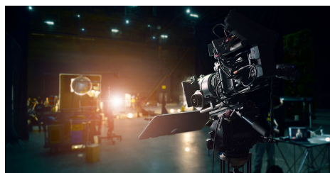
I en studio där en reklamfilm möjligtvis hade kunnat bli inspelad i.

I undersökningen visas också, precis som i en studie av Grusell